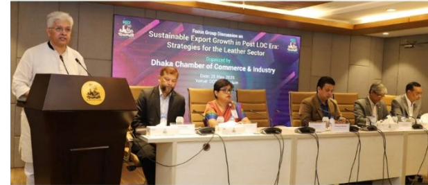
শিল্প উপসেট্টা আদিলুর রহমান খান গতকাল রাজধানীতে ডিসিসিআই আয়োজিত সেমিনার প্রধান অতিথির বক্তৃতা দেন।

To ensure sustainable export growth in the post-LDC era, he recommended for green transformation of tanneries, skills development, improved value chain, strong backward linkage, exploring new export destinations and public-private collaboration with a view to make this sector a pillar of the country's sustainable export item.