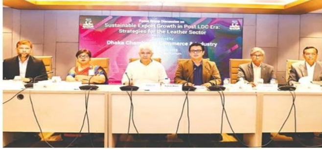
রাজধানীতে রবিবার ডিসিসিআই আয়োজিত 'চামড়া শিল্পের কৌশল নির্ধারণ : এলডিসি-পরবর্তী টেকসই রপ্তানি' শীর্ষক মতবিনিময় সভায় উপস্থিত অতিথিরা।