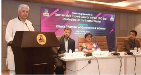
রোববার ডিসিসিআই উদ্যোগে আয়োজিত চামড়া শিল্পের বৈশিষ্ট্য নির্ধারণ, এলভিসি পরবর্তী টেকসই রপ্তানি শীর্ষক সেমিনারে শিল্প উপদেষ্টা।

ঢাকা, ২৫ মে, ২০২৫ (বাসস) : শিল্প উপদেষ্টা আলিবুর রহমান খান বলেছেন, চামড়া শিল্প খাতে সম্ভবত উন্নয়নের জন্য ট্যানারি এস্টেটে প্রশিক্ষণ ও ডিজাইন সেন্টার প্রতিষ্ঠার উদ্যোগ গ্রহণ করা হয়েছে।